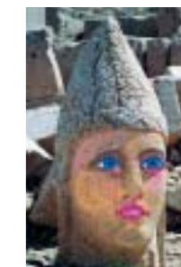
Opera di Michel Pichet www.fisicnucleare.org

"Le pietre scartate... se, come e quando diventano pietre angolari?"