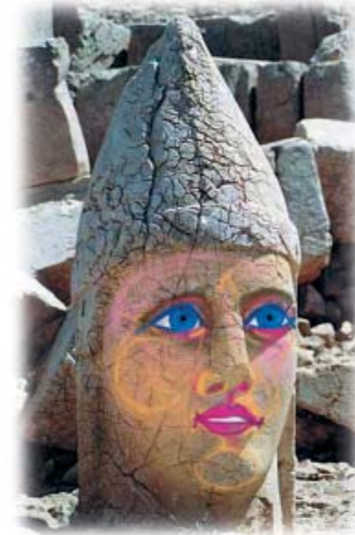
Opera di Michel Pochet www.flars.netcentromaria

La pietra scartata dai costruttori è divenuta testata d'angolo... (SAL. 118)